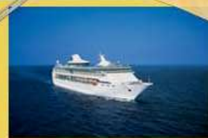
SPLENDOUR OF THE SEAS